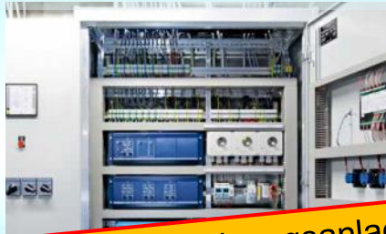
Albis Bettwarenfabrik AG:

Optimierung Heizungsanlage 73% tiefere Stromkosten