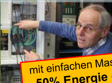
GMC-Instruments Schweiz AG:

mit einfachen Massnahmen 50% Energie gespart